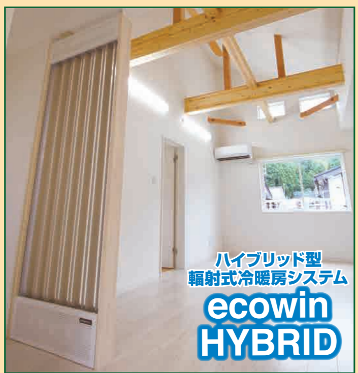
ハイブリッド型 輻射式冷暖房システム ecowin HYBRID

12/9(日) AM 10:00~AM 12:00 予約締切 12/7(金) 南魚沼市坂戸112-3 TEL 025-778-1430 担当まで